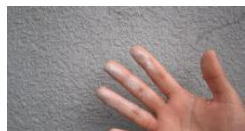
チョーキング現象